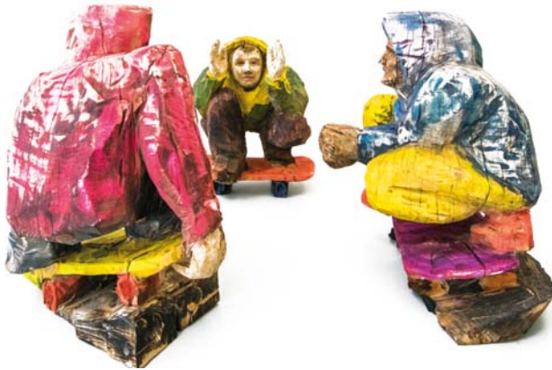
Skater I, II, III Eiche, farbig gefasst Höhe 100 cm