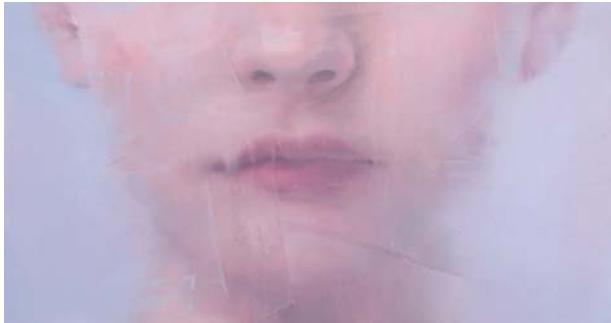
The great below P.S. I-18 Öl auf Leinwand 80 x 150 cm

2012 Diplom Bildende Kunst Malerei und Grafik / diploma in Fine Arts and Graphic Arts