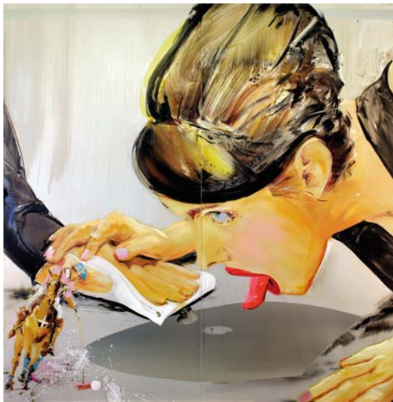
Snow Moskau Öl auf Aluminium 200 x 200 cm

1989 Studium am Pratt Institute, New York, US / studies at Pratt Institute, New York, US