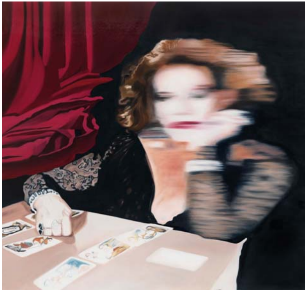
La magicienne Öl auf Leinwand 170 x 180 cm

2010 Erste Veröffentlichung des malerischen Schaffens / first public notice of the paintings